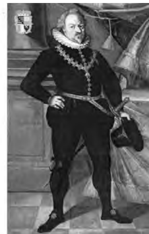
Výstava k 390. výročí příchodu Liechtensteinů na Černokostelecké panství 1623 - 2013

-zkrácené info převzato z webu města Č. Brod-